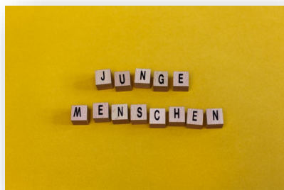
Kevin Fuchs (CC BY 4.0)

dann seid Ihr bei Take 5 genau richtig! Take 5 bietet hierfür eine Plattform an. Wir möchten Euch Zeit und Raum geben, um Euch mit Politiker*innen auszutauschen. Dabei könnt Ihr von Anfang an Eure Ideen einbringen und für Euch wichtige Themen setzen.