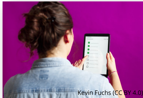
Kevin Fuchs (CC BY 4.0)

Ministerium für Soziales, Integration und Gleichstellung